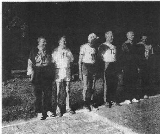
Veteranai nutarė jėgas išbandyti distancijoje.