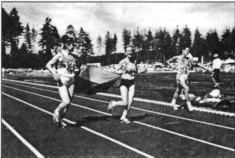
Lietuvos tautinė Trispalve po pergalių buvo galima džiugtis tik taip

Po šių varžybų ėjikai startavo Olandijoje, Suomijoje, Belgijoje, VFR, Italijoje ir Šveicarijoje. Visur džiugino puikiais rezultatais. Šį sezoną Lietuvos ėjikai net 68 kartus gerino Lietuvos ir pasaulio rekordus ir aukščiausias pasekmes. 1990 m. IAAF sportinio ėjimo komiteto statistiniame leidinyje, kuriame skelbiami 1989 m. ir 1990 m. (iki kovo 31 d.) pasaulio olimpinių rungčių sportinio ėjimo rekordai ir aukščiausios pasekmės, o taip pat ir įvairių kitų, mums dar neįprastų, distancijų aukščiausios pasekmės. Pvz., 1500 m, 1 mylios, 2 mylių, 100 mylių, 100 km, 200 km 12 ir 24 val. ėjimas vyrams ir