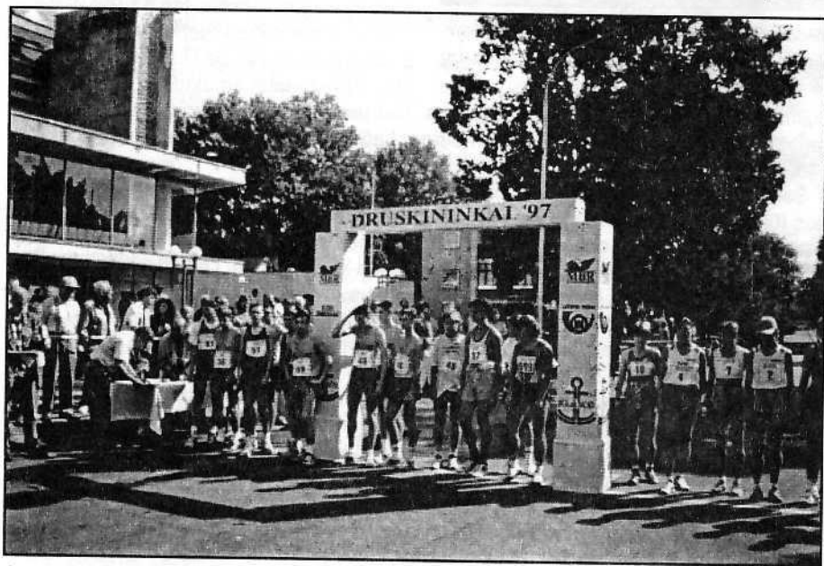
Starte Druskininkų ėjimo taurės dalyviai

Birželio 25 dieną Kėdainių rajone, Krakėse vyko tradicinės laikraščio "Lietuvos sportas"