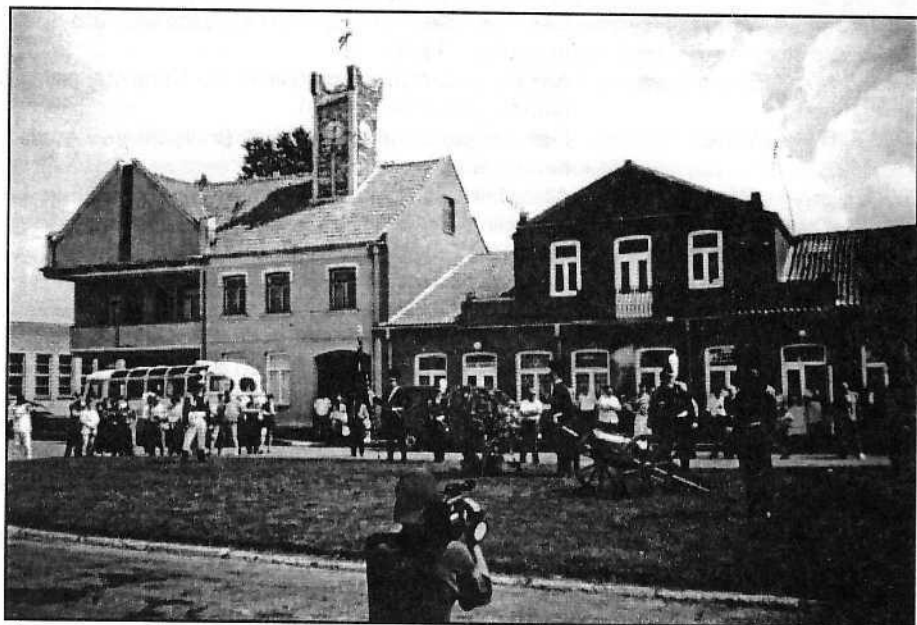
Čia ne užsienis. Čia Krakės. Tuojau iššaus senovinė patranka ir varžybos prasidės